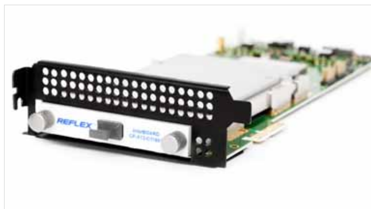
上图为我公司最新发布的产品 - 全新的 100G 模块。